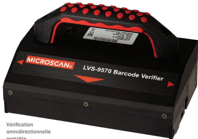
Vérification omnidirectionnelle portable